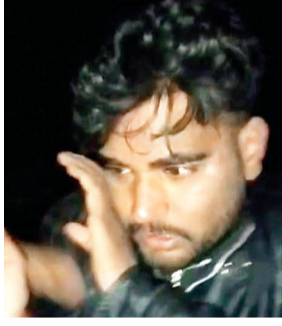
संबंधित धाराओं के तहत मामला दर्ज कर लिया है।

सीहोर। शाहगंज क्षेत्र में शराब के मामले को लेकर एक युवा किसान और उसके दोस्त पर शराब कारोबारी पिता-पुत्र सहित तीन लोगों ने बेरहमी से पीटाई कर दी और जान से मारने की धमकी दी। घटना 10 नवंबर की रात की है जिसकी रिपोर्ट पीड़ित ने उर के कारण पांच दिन बाद 15 नवंबर को शाहगंज थाने में दर्ज कराई।