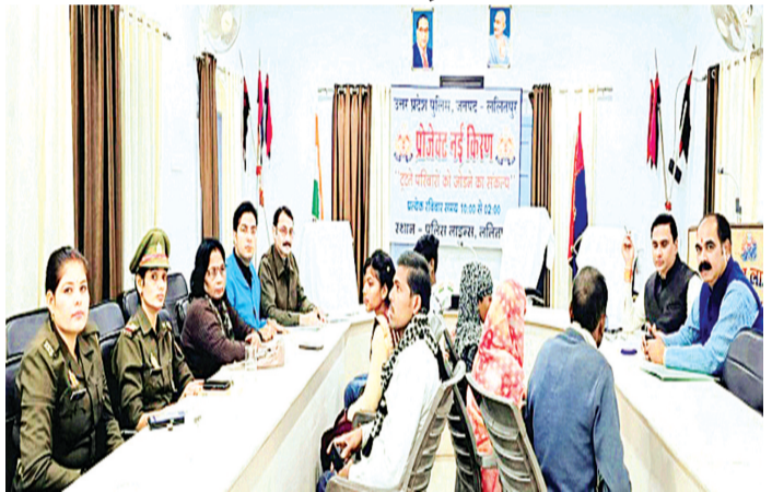
हरिभूमि न्यूज ललितपुर

स्थानीय पुलिस लाइन सभागार में पुलिस अधीक्षक के निदेशन में प्रोजेक्ट नई किरण का आयोजन किया गया, जिसमें नई किरण के सभी सदस्यों द्वारा समझाने के बाद एक परिवार में आपसी सुलह के आधार पर समझौता कराया। एक परिवार